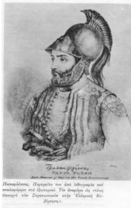
Παπαφλέσσα. Πορτρέτο του από λήθη από τον καλλιγράφο του Ζωγράφου. Το άνω μέρος της εικόνας αποτελεί την Στρατιωτική στην Έλληνική Κο- μίση.

Τό ιερώτερον και πρωταρχικόν ανθρώπινον Καθήκον είναι η δι' αμυντικών πολέμων προάσπις τής Ελευθερίας και των Ήθικων Αξιών. Εις τήν εκτέλεσιν τούτου επρότευσαν οι Φλεσσαίοι κατά τήν μακράν διαδρομήν τών 8 αιώων του Ιστορικού των βίου.