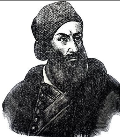
ΥΠΗΓ. ΔΙΚΑΙΟΣ Ή ΠΑΠΑΦΛΕΣΣΑΣ Ξυλογραφία-Βιβλιοθήκη Κ. Θ. Δημαρά