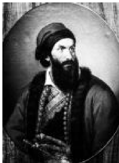
Ελαιογραφία-Εθνικό Ιστορικό Μουσείο Δημιουργός Τσόκος Διονύσιος.