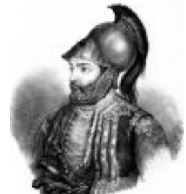
Λιθογραφία-Γεννάδιος Βιβλιοθήκη Δημιουργός Fridel A.