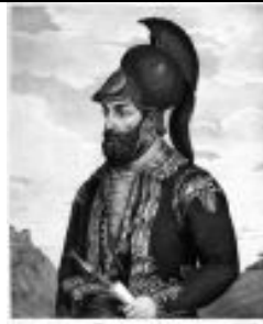
Έγχρωμη λιθογραφία - Γεννάδιος Βιβλιοθήκη Δημιουργός Fridel A.