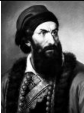
Ελαιογραφία-Εθνικό Ιστορικό Μουσείο Δημιουργός Τσόκος Διονύσιος.