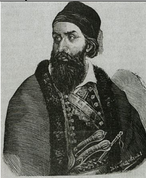
Κλισέ Ξυλογραφίας F.C.H.L. Rouqeville